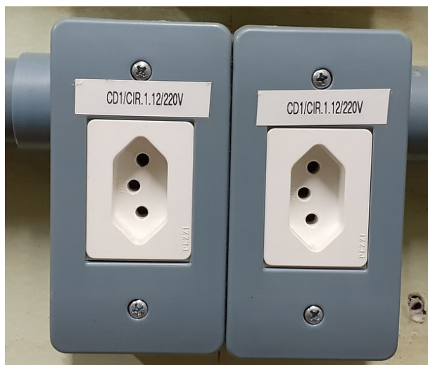
Figura 1 - Exemplo de identificação de tomada.

Todas as tomadas devem ter a identificação do circuito ao qual pertencem através de etiquetas adesivas. Um exemplo de identificação de tomada pode ser visto na Figura 1, onde está identificado o quadro de distribuição, o circuito e a tensão da tomada.